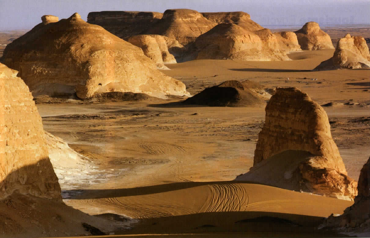
Quelques-unes des formidables formations rocheuses d'Agabat, un site où l'on se sent tout petit.