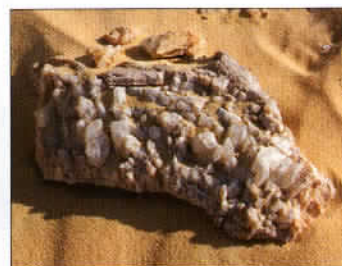
De jolies concrétions cristallines parsèment le désert.