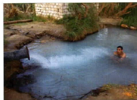
Une source d'eau chaude où les oasiens de Bahareya aiment à se refaire une beauté.

Les montagnes de Dest et Maghrifa situées à 7 km du Lazuli Lodge, point de chute exceptionnel pour partir à la découverte du désert libyque.