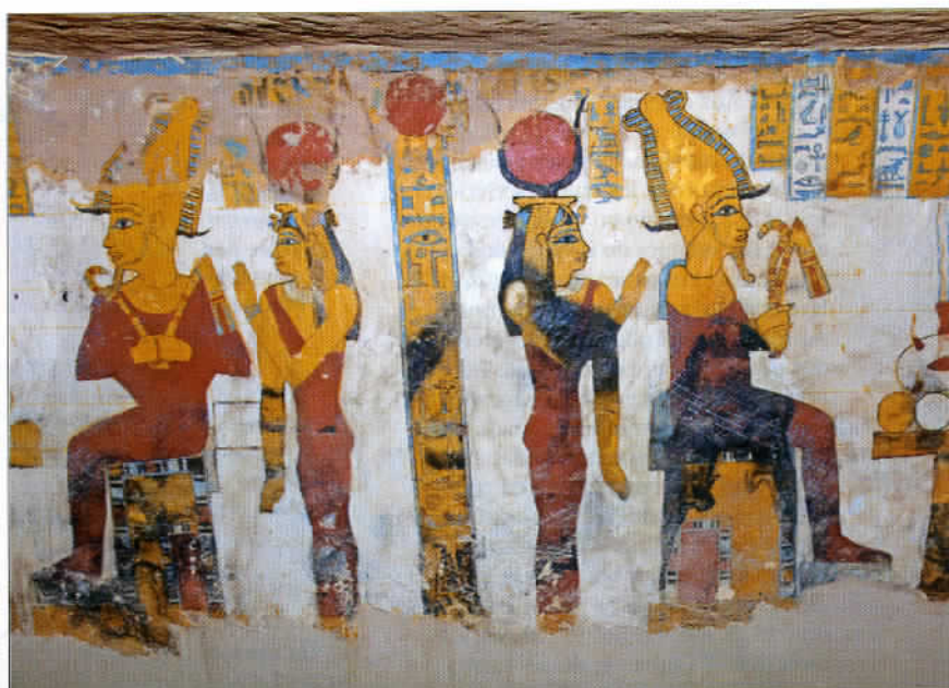
Des fresques murales peintes sur les murs du tombeau d'un dignitaire de l'Égypte antique, à admirer dans les environs du Lazuli Lodge à Bahareya.