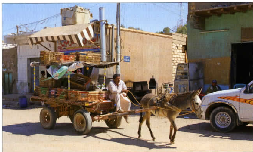
Un équipage typique dans les rues de Bahareya. Le 4x4 local d'avant, le 4x4 à quatre pattes motrices.