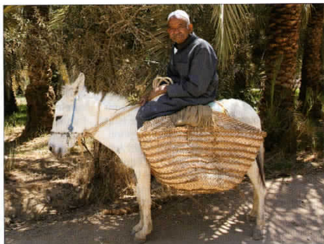
Un beau vieillard à l'abri des palmiers par 35° à l'ombre. Gare à l'insolation.